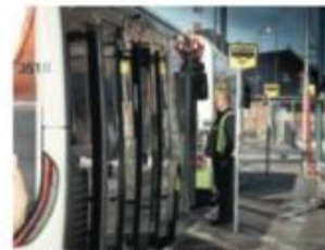
Der er stadig langt mellem kunderne i busserne - men til gengæld er der ikke så langt mellem snydere.

Siden december har der været fuldstændig ubetalt i busserne, og under coronakrisen er chaufførerne skærmet helt af for at undgå passagerkontakt og dermed blive smittet for smitte. Men det er altså ikke ensbetydende med, at man ikke skal be-