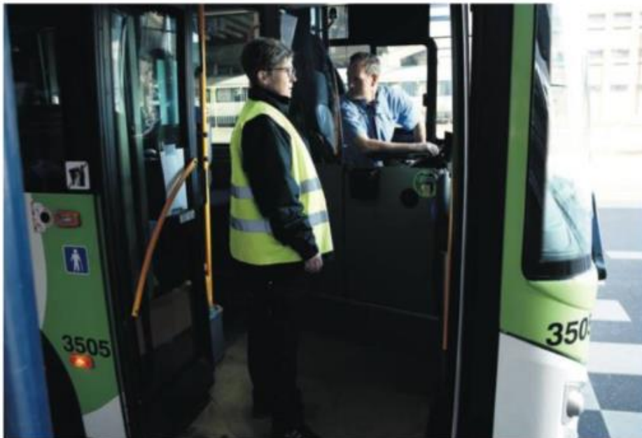
Kontrollørerne i Fynbus er vendt tilbage på arbejde efter at have været hjemme i første uger af coronapandemien. Der er ikke mange passagerer i busserne, men det, der er, Snyder til penge i stor stil med bilkøen.

1235 Knudsgade, 65 45 52 43 1235@fyb.dk Knutsgade 1235, 65 45 52 43 1235@fyb.dk 1235@fyb.dk 1235@fyb.dk 1235@fyb.dk 1235@fyb.dk