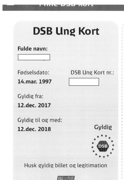
Klagerens DSB Ung Kort

Den 21-årige klager var indehaver af et DSB Ung Kort, som han havde købt i DSB's mobilapp med gyldighed fra 12. december 2017 til 12. december 2018.