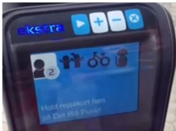
Herefter ændres antal til 2 voksne