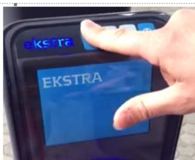
Man aktiverer standen ved at trykke på en af tasterne