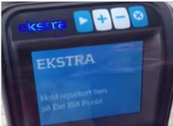
Besked om at holde kortet hen