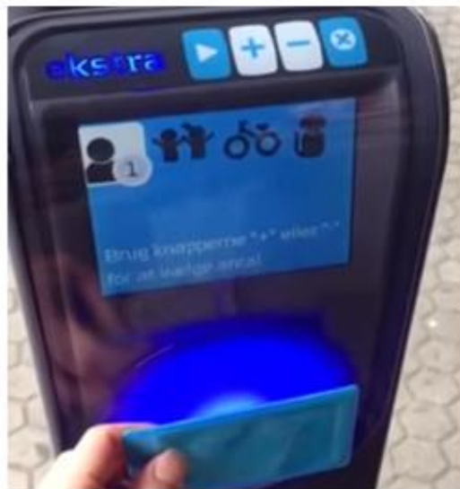
Derefter vises, at 1 voksen er registreret