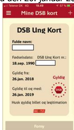
Klagerens DSB Ung Kort

Klageren, som er 27 år gammel og studerende, var indehaver af et DSB Ung Kort, som han havde købt i DSB's mobilapp med gyldighed fra den 26. januar 2018 til 26. januar 2019.