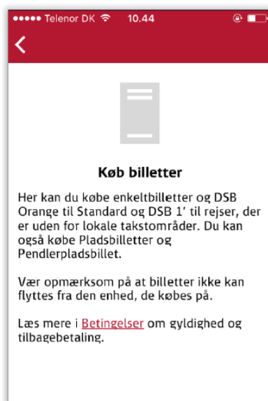
Eksempel på bestillingsforsøg i DSB's mobilapplikation fra Hørning st. til Aarhus H